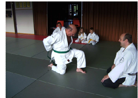
Fier omgord hij zijn nieuwe gordel