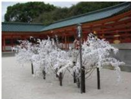
Een wensboom in Japan.

Met nieuwjaar wordt er ook veel gefeest en gedanst.