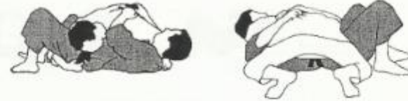
yoko shio gatame

Bepaling: zijwaartse (yoko) controle (katame) langs de vier (shi) hoeken.