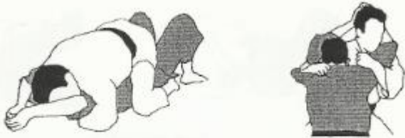
tate shiho gatame

Bepaling: vertikaal (tate) controle (katame) houden op vier (shi) punten