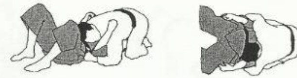
kami shiho gatame

Bepaling: langs boven (kami) controle (katame) houden op vier (shi) punten